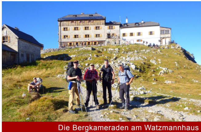
Die Bergkameraden am Watzmannhaus

auf Brücken und rustikalen Holzstegen die Wimbachklamm. Breite Bergpfade geleiten die vierköpfige Truppe sodann über die Stubenalp hinauf zur bewirtschafteten Mitterkaseralm. Hier wird erste Rast gehalten. Überaus imposant sind anschließend die Ausblicke hinüber zum Hohen Göll und auf Watzmannfrau und Watzmannkinder, die an der Falzalm in Augenschein genommen werden. Nach etwas mehr als drei Stunden Aufstieg wird auf felsigen Steigen das Watzmannhaus erreicht, um dort zur Nachruhe einzukehren.