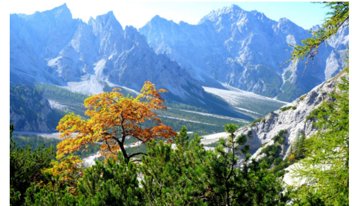
Herbstwald beim Abstieg ins Wimbachgries

Auf einer Seehöhe von 2.712 Metern eröffnet sich den Bergkameraden ein gigantisches Alpenpanorama. Der Gipfel des Großen Hundstods und in der Ferne der des Großvenedigers sind von der Südspitze zu bewundern. Darüber hinaus begeistern traumhafte Panoramablicke ins Wimbachgries und auf St. Bartholomae. Nach ausgiebiger Gipfelrast und einem Eintrag ins Gipfelbuch folgt der lange Abstieg ins Tal.