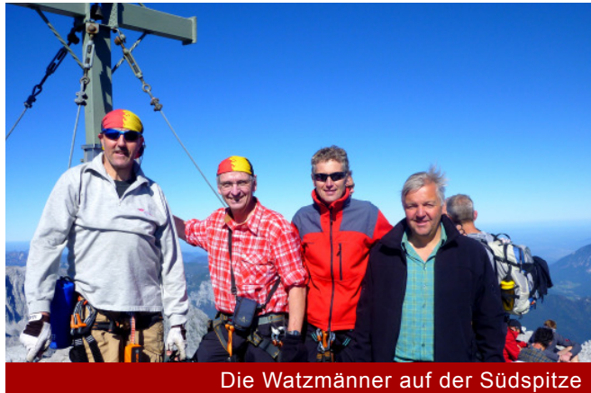
Die Watzmänner auf der Südspitze

gewaltigen Ausmaße der Watzmannostwand, eine der gewaltigsten Felswände in den Ostalpen, beeindruckt die Bergsteiger sehr. Ungleich länger und schwieriger zeigt sich die Überschreitung im weiteren Verlauf. Der Grat wird deutlich schmaler und das Gelände fällt jetzt nach links fast lotrecht in die Ostwand hinein. Aber auch rechter Hand bricht der Fels nicht weniger steil ins Wimbachtal ab. So ist überaus achtsames Klettern erforderlich, um mehrere ungesicherte Stellen im ersten Klettergrad zu durchsteigen.