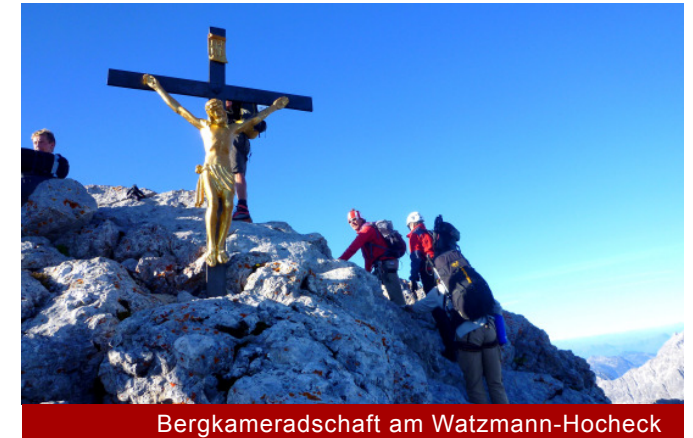
Bergkameradschaft am Watzmann-Hocheck

wunden hat, flacht das Gelände wieder leicht ab. Kurzzeitig wird einfaches Gehgelände durchschritten. Über Felsenplatten geleitet ein steiler, mächtiger Aufschwung die Bergwanderer dann zum Watzmann-Hocheck hinauf, dem ersten der drei Watzmanngipfel.