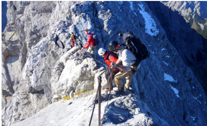
Bergkameraden klettern über den Watzmanngrat

Gut griffiger Fels, der allerdings durch die vielen Begehungen extrem glatt poliert ist, führt vom Watzmann-Hocheck ein kurzes Stück bergab. Dann geht es über eine Rampe an Drahtseilsicherungen, in die man sich einhängen kann, wieder hinauf in den steilen Fels. Mal führt die Route direkt über die Gratschneide, dann wieder rechts oder links des Zackengrates in ständigem Auf und Ab zur Mittelspitze hinüber, deren mächtiger Gipfelstock immer näher rückt.