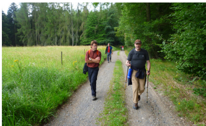
Bergkameradschaft am Steinerberg

wir jedoch auf den Gipfelanstieg und wandern auf einem uralten, kaum noch begangenen Waldpfad in den steilen Hang hinein. In unzähligen Kehren windet sich der Steig bergan. An Felswänden vorbei und unter umgestürzten Bäumen hindurch mit mehreren herrlichen Aussichten ins Ahrtal, steigen die Bergkameraden recht mühsam zum Schrock hinauf. Von der urigen, windumtosten Schutzhütte fällt der Blick dann überaus bemerkenswert ins Ahrtal hinab, bevor uns ein Felsensteig durch Krüppel-eichenbestände noch einmal ansteigend und jetzt wieder auf dem Ahr-Venn-Weg, zum Steinerberg bringt.