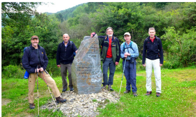
Auf dem historischen Richtplatz bei Ahrbrück

Die Marathonwanderung 2011 führt die Watzmänner auf zwei Weitwanderwegen des Eifelvereins durch das wildzerklüftete Ahrgebirge. Von Ahrbrück nach Altenahr wird auf dem Karl-Kaufmann-Weg gewandert. Dem Ahr-Venn-Weg folgen die Bergkameraden sodann von Altenahr nach Sinzig. Während im ersten Teil der Strecke bis Ramersbach oftmals schmale, felsige Waldpfade die Streckenführung bestimmen, folgt die Route im zweiten Abschnitt der Marathondistanz von 42 Kilometern recht unspektakulär und höhengleich meist breiten Forstwegen.