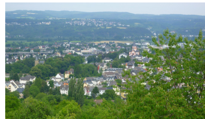
Blick vom Feltenturm auf Sinzig und ins Rheintal

kurz darauf Ramersbach. Im Gasthaus Halfenhof wird Mittagseinkehr gehalten. Danach gehören erdige Pfade und Felsensteige der Vergangenheit an. Fast schnurgerade, höhengleich und wenig spektakulär verläuft der Ahr-Venn-Weg durch den Königsfelder Forst und später durch den Neuenahrer Wald. Eine mächtige, vierstämige Buche am Wegrand wird von den Bergkameraden bewundert, bevor der Blick über das Ahrtal hinweg auf die Neuenahrer Landskrone fällt, einem herausragenden Aussichtsberg im unteren Ahrtal. In der Nähe von Löhdorf ist noch einmal ein sanfter Anstieg zu meistern, dann wartet der Feltenturm auf die Weitwanderer.