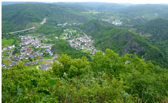
Traumhafte Aussichten vom Altenburger Horn

Stelle ein Richtplatz befunden hat. Hier „Auf Wolfsgraben“ wurden seinerzeit Todesurteile vollstreckt und auch Hexen hingerichtet. Breite Waldwege führen von dieser schaurigen Stätte sodann durch lichte Buchenbestände hinüber zum ersten Aussichtspunkt, dem Altenburger Horn. Aus der Vogelperspektive genießen die Weitwanderer von diesem hohen Felsennest die überaus bemerkenswerten Aussichten über das Ahrgebirge.