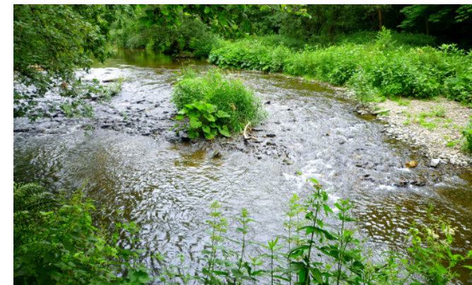
Die Ahr im Langfigtal

Waldpfad, der sie überaus steil hinab ins Ahrtal und nach Altenburg führt. In dem kleinen Ort wird die Bundesstraße gequert und auf einem schmalen Eisensteg die Ahr überschritten. An der Maternus-Kapelle vorbei folgen die Watzmänner dem Karl-Kaufmann-Weg nach Altenahr.