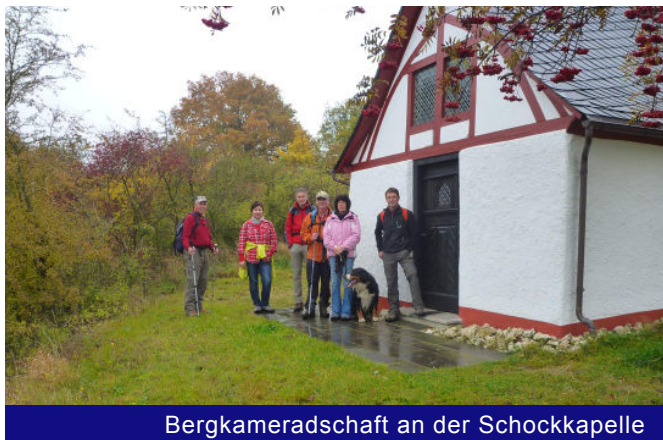
Bergkameradschaft an der Schockkapelle

In Premiumqualität und überaus abwechslungsreich zeigt sich der Layensteig Strimmiger Berg dem ambitionierten Traumschleifenwanderer. Verschlungene Pfade durch zwei wildromantische, naturbelassene Bachtäler, grandiose Fernsichten über die Hunsrückhöhen und felsige Steige in steilen Hanglagen sorgen für ein herausragendes Wandererlebnis. Das absolute Highlight in der nur 14 Kilometer langen Rundwanderung bilden jedoch zwei kurze Klettersteigpassagen, die allerdings auch umgangen werden können. Die Watzmänner starten die Tour am Eingangsportal Mittelstrimmig und wandern hinüber zur Schockkapelle.