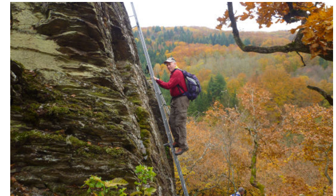
Leiter im Burgberg-Klettersteig

Gerne nehmen die Watzmänner auch diese kleine Herausforderung an. Über Steigeisen und an fest installierten Drahtseilen wird erneut steil bergauf geklettert. Mehrere felsige Abschnitte sind zu meistern, bevor man zum Panoramablick Große Kanzel gelangt. Eine Sinnenbank lädt hier zum Verweilen ein. Die Aussichten hinab ins Flaumbachtal sind auch von diesem Felsensporn überaus bemerkenswert.