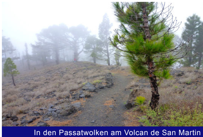
In den Passatwolken am Volcan de San Martin

herausragenden Panoramapunkt. In Minutenschnelle aufziehende Passatwolken verwehren uns allerdings die Aussichten hinüber zum Volcan de San Martin und die sicherlich grandiosen Fernblicke hinunter zum Meer und auf die Gestade von La Palma. Stattdessen umfängt uns dichter Nebel und die Sicht voraus beträgt stellenweise nur noch zehn Meter.