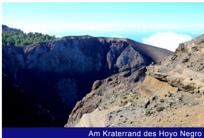
Am Kraterrand des Hoyo Negro

einen herrlichen Kiefernwald hinein. Den aufziehenden Passatwolken entnehmen die langen Nadeln der kanarischen Kiefer die reichlich vorhandene Feuchtigkeit und geben sie bis an die Wurzeln des Baumes ab. Die lange Trockenperiode im Sommer kann so ohne Probleme überbrückt werden. Ständig bergan wandernd ignorieren wir den Abzweig zum Vulkan Birigoyo, den wir links liegen lassen und folgen dem Hauptweg mit seiner rot-weißen Markierung. Kurz darauf fällt der Panoramablick ins Aridanetal und auf Los Llanos, die größte Stadt der Insel.