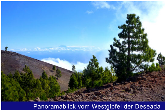
Panoramablick vom Westgipfel der Deseada

Neben den grandiosen Aussichten auf den bereits zurückgelegten Teil der Vulkanroute über den Kamm der Cumbre Vieja, ist bei guter Sicht und über den Wolken der Gipfelaufbau des Teide auf der Nachbarinsel Teneriffa zu erkennen. Mit seinen 3.718 Höhenmetern ist er der höchste Berg Spaniens. Aber auch die Blicke hinüber zum etwas höheren Ostgipfel und in den gewaltigen Kraterschlund des Vulkans Deseada beeindruckt die Wanderer sehr.