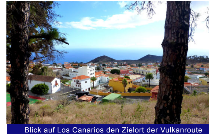
Blick auf Los Canarios den Zielort der Vulkanroute

aufzogen, verweht sie der auffrischende Wind. Mit solchen kurzfristigen Wetterkapriolen muss man in der Ruta de los Volcanes jederzeit rechnen. Schließlich bewegen wir uns noch auf einer Seehöhe von 1.600 Metern. Ständig talwärts wandernd geht es wenig später durch herrliche Pinienwälder. Vulkanausbrüche der zurückliegenden Jahrhunderte haben hier eine raue, zerklüftete Landschaft entstehen lassen, welche die Wanderer mit unzähligen bizarren Lavaformationen und einzigartigen Eindrücken in ihren Bann zieht.