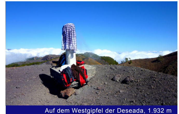
Auf dem Westgipfel der Deseada, 1.932 m

Kesselwänden hinüber zu führen. Dieser Vulkan ist letztmalig im Jahre 1949 ausgebrochen. Seine Lavamassen wälzten sich bis zum Strand von Puerto Naos und schufen dort eine neue Landzunge, die weit ins Meer hineinragt.