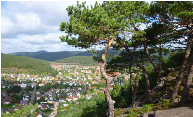
Aussichten auf Hauenstein vom Kahlen Felsen

Die Hauensteiner Felsentour im Herzen der Pfalz begeistert jeden Wanderer. Unzählige Sandsteinformationen, die begangen oder auf spektakuläre Weise erklettert werden können, liegen am Wegrand. Herrliche Ausblicke über den Pfälzerwald und die malerischen Ortschaften sorgen für ständige Kurzweil und eine Wegführung, die in der Mehrzahl Wald- und Felsenpfade aufweist, machen diese Route zu einem Premiumwanderweg der Extraklasse der auch in der Pfalz Seinesgleichen sucht.