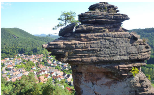
Der Friedrichsfelsen bei Lug - Luger Fritz -

bäume begleiten uns auf dem steil ansteigenden Pfad hinauf zum Friedrichsfelsen, im Volksmund „Luger Fritz“ genannt. Dieser herrliche Aussichtsfelsen gestattet einen herausragenden Blick auf die Ortschaft Lug und auf die Felsformationen des Kleinen Rauhberges, den wir gleich im Anschluss noch erwandern werden.