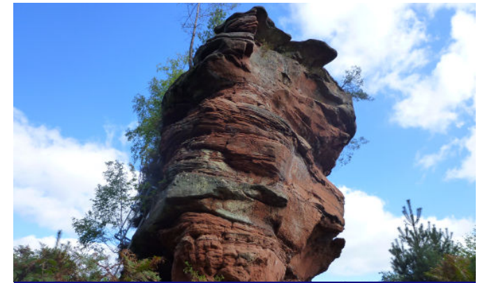
Der erkletterbare Hühnersteinfelsen

die vom Pfälzerwaldverein Hauenstein installiert wurde, erklimmen. Die Watzmänner machen natürlich Gebrauch davon. Von seiner Aussichtsplattform schweift der Blick dann weit über den Pfälzerwald. Burg Trifels bei Annweiler und die Erhebungen des Dahner Felsenlandes sind von hier aus gut auszumachen und werden von einer stählernen Windrose genau bezeichnet.